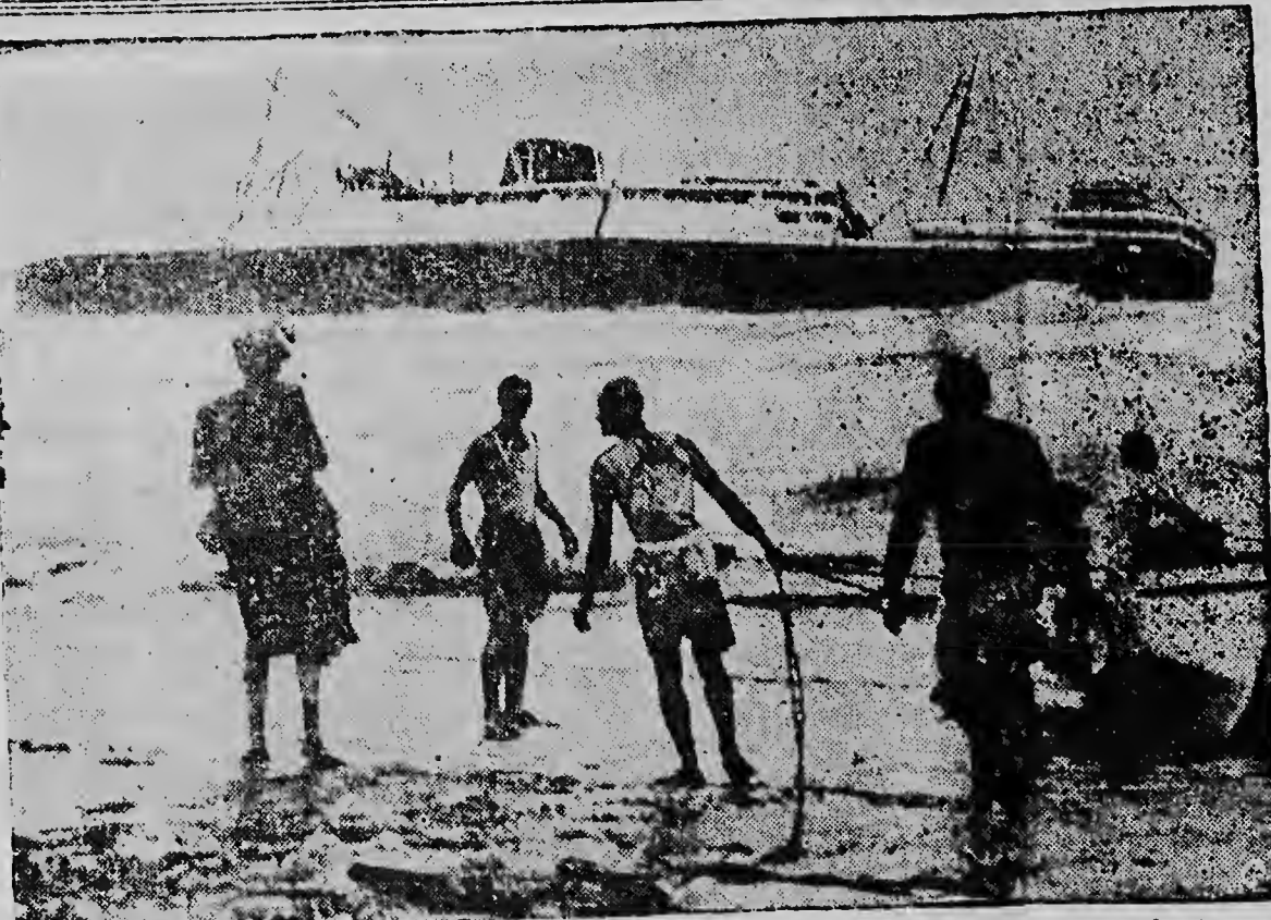
HET FRANSE SCHIP „CHAMPILLION” is, zoals we reeds schreven, op de Libanese kust aan de grond gelopen. Hierboven ziet men hoe Libanezen trachten met een reddingsboot zoveel mogelijk van de 318 personen van boord te halen. Zes en twintig personen konden niet worden gered. De meeste passagiers waren pelgrims, ide voor de Kerstdagen in het Heilige Land wilden zijn.

Dat zou niet zo erg zijn, maar het kind weet nog altijd niet wat het doen moet. En de ouders zitten er maar mee. Dat kind moet toch gaan lopen. Nu kunnen die ouders twee dingen doen. Zijn ze erg nerveuse mensen, dan worden ze kwaad en gaan er steeds harder op slaan, ze gaan dus steeds verder op de verkeerde weg. Want het kind leert nog maar steeds niet hoe het wel moet. We kunnen dus steeds zwaarder gevangenisstraffen uitsdelen, het politiek niveau wordt er echter niet beter op. Afgescheiden daarvan, dat de gevangenis nog nooit opvoedend gewerkt heeft, heeft ze in de praktijk (Vervolg op pag. 3)